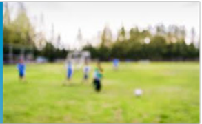
အမြင်အာရုံမှုန်ဝါးလာခြင်း