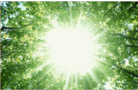
အလင်းစူးခြင်း