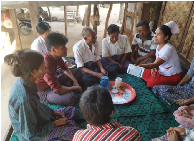
Mobile Tablet များအသုံးပြု၍ ကျန်းမာရေးအသိပညာပေးလုပ်ငန်းများ ဆောင်ရွက်ခြင်း